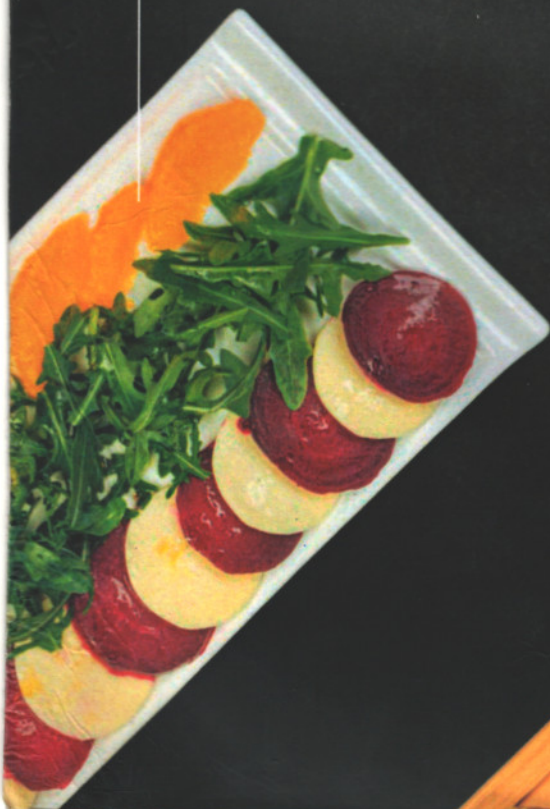
Капрезе со свеклой Caprese with beets