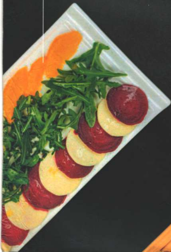
Капрезе со свеклой Caprese with beets